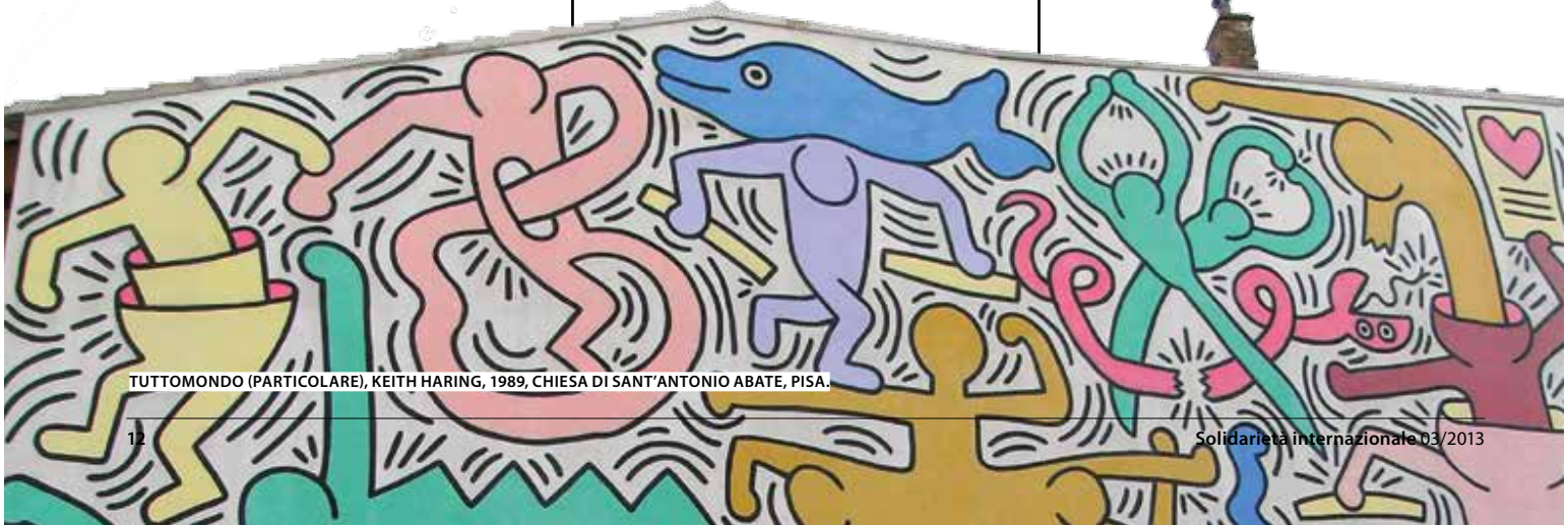
TUTTOMONDO (PARTICOLARE), KEITH HARING, 1989, CHIESA DI SANT'ANTONIO ABATE, PISA.

È importante l'arrivo del nuovissimo Trattato sul Commercio delle armi approvato in aprile all'Assemblea generale dell'Onu con il sostegno di oltre 150 paesi, Italia compresa. Il nostro ministero degli Esteri ha dichiarato: "Si apre la strada alla determinazione di un quadro giuridico internazionale, della cui assenza hanno finora approfittato tutti coloro che hanno alimentato il traffico illecito di armi, a danno soprattutto delle popolazioni vittime di conflitti armati nelle aree più travagliate del mondo". Poche illusioni, ma realisticamente occorre approfittare di tutte le opportunità. Questo nuovo trattato dovrà disciplinare a livello internazionale il commercio di armi e creare degli standard per i trasferimenti per ridurre la vendita di prodotti demenziali. Il testo in